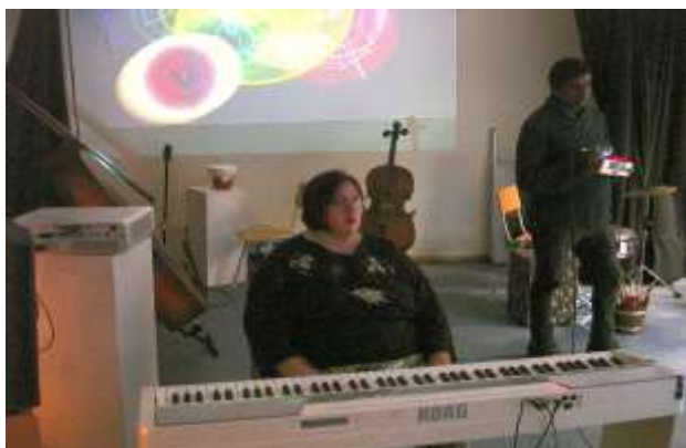
Imaginea 3: mic ansamblu format ad hoc:

Un feedback informativ vine de la public după a doua acțiune muzicală. O membră a grupului s-a simțit, de asemenea, legată de muzica de pe scenă ca spectatoare, spre deosebire de un concert la care participase recent, unde fusese doar spectator și experimentase muzica de la distanță. Cu BlueScreen, rolurile se schimbă. Toată lumea este parțial pe scenă și parțial în public și rămâne conectată cu evenimentul și muzica de-a lungul întregii serii. Jochen rezumă seara: „O seară frumoasă a trupei, o reticență destul de elegantă, fără heavy metal azi“.