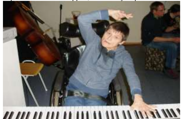
Image 4: Sound and movement impressions on the keyboard

“BlueScreen is still a lay ensemble after about 20 years. Nevertheless, we always try to bring the most professional music and show or performance on stage, and we always succeed. I think that’s great, but it’s also my biggest stress. The music of BlueScreen is to a large extent improvisation, even if we perform compositions and the like, such as the accompaniment to the silent movie ‘The Journey to the Moon’ (original title: Le Voyage dans la Lune ), a science fiction Film by the French film pioneer Georges Méliès from 1902. In improvisation, the favour of the moment, the kiss of the muse, is what makes it all so special, and that does not necessarily happen in stress, but rather in the force field of abandonment and trust in the tension and relaxation, in the improvisation. That is very difficult to do, you have to permit it or let it happen, and we try to practice that.”