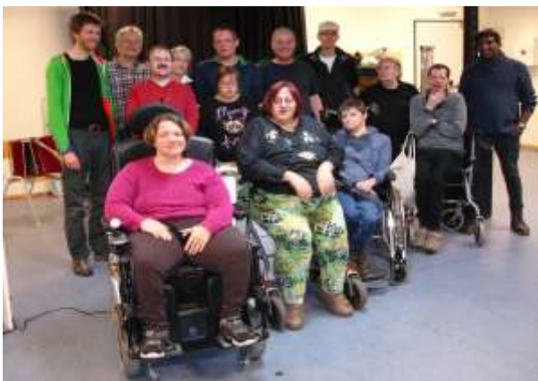
Imaginea 1: Ansamblul BlueScreen

Sarcinile liderului includ, printre altele, crearea unui grup „adecvat“ și implicarea tuturor membrilor grupului. Caracterele diferite se pot completa reciproc în acest fel. Pentru ca improvizația muzicală comună să reușească, ea necesită un spațiu de creație care protejează indivizii și grupurile, un spațiu de interacțiune conștientă, respectuoasă și afectuoasă, astfel încât indivizii să se poată arăta așa cum sunt ei în momentul respectiv, cu puncte slabe și puncte forte, și să își dezvolte abilitățile. Ea necesită o atmosferă de lucru care stimulează și provoacă creativitatea și o muncă continuă în care familiarul și noul sunt aduse împreună ca fiind încă necunoscute. Aici, ritualurile sunt un ajutor educațional deoarece „ritualurile pot întări identitatea, pot orienta, organiza și stabiliza sentimentele, promovează legăturile sociale și responsabilitatea comună“ [7, 150] pentru a numi doar câteva din beneficiile ritualurilor enumerate de Liebertz, pe care le prezintă în detaliu în cartea sa despre conceptele de joc pentru învățare holistică. [7,150-158].