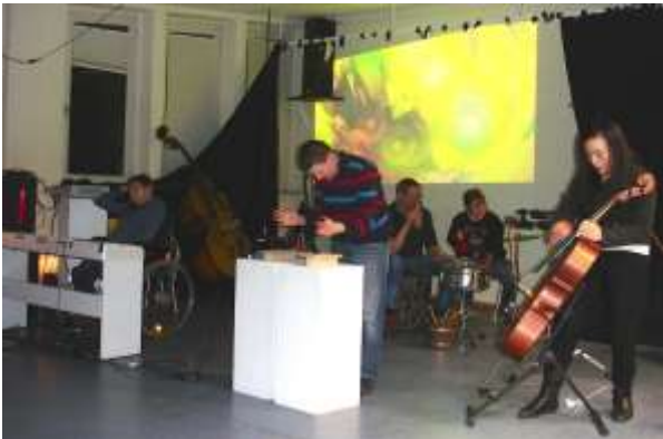
Imaginea 5: mic ansamblu format ad hoc:

În conceptul de improvizație prezentat de ansamblul BlueScreen, învățarea are loc prin percepție și interacțiune muzicală. Un proces continuu, în evoluție, apare ca rezultat muzical perceptibil pentru interpreți și spectatori. Regulile puține, simple și clare ale jocului conduc la o muzică transparentă, în care fiecare persoană poate fi auzită cu instrumentul său și unde are loc o relație cu evenimentele sonore din spațiu. Grupele mici organizate în mod clar și o atmosferă de scenă fără stres oferă fiecărui interpret posibilitatea de a percepe și de a se bucura de contribuția sa la scena muzicală. Se recurge apoi la memorie pentru a se face referiri verbale la procesul de improvizație pentru a vorbi despre muzică și pentru a reflecta asupra propriilor acțiuni și percepțiilor asupra acțiunilor celorlalți, fără evaluări, dar cu comentarii provocatoare din partea liderului.