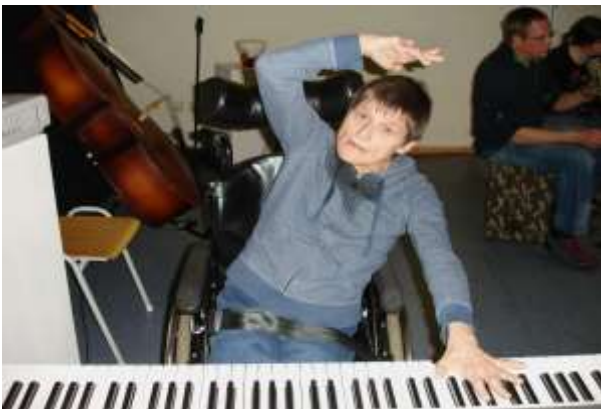
Imaginea 4: Impresii de sunet și mișcare la keyboard

„BlueScreen este încă un ansamblu laic după aproximativ 20 de ani. Cu toate acestea, încercăm întotdeauna să aducem pe scenă cea mai profesionistă muzică sau cel mai profesionist spectacol și reușim întotdeauna. Cred că e minunat, dar este și cel mai mare stres al meu. Muzica ansamblului BlueScreen este într-o mare măsură improvizată, chiar dacă interpretăm compoziții și altele asemănătoare, cum ar fi acompaniamentul filmului mut „Călătoria spre Lună“ (titlul original: Le Voyage dans la Lune ), un film de science fiction al cineastului pionier Georges Méliès din 1902. În improvizatie, favoarea momentului, sărutul muzei este ceea ce face totul atât de special și nu se întâmplă neapărat în stres, ci mai degrabă în câmpul de forță al abandonului și încrederii în tensiune și relaxare, în improvizatie. Acest lucru este foarte greu de făcut, trebuie să-l permiți sau să-l lași să se întâmple și încercăm să practicăm asta.“