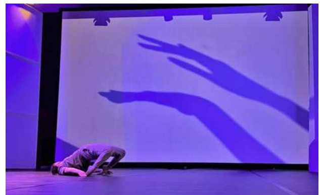
Figura 3. Imagini din timpul repetițiilor, proiecție video.