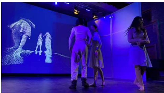
Figure 2. Picture taken at the rehearsal, video projection based on live images, captured with the Kinect sensor.

organized according to aesthetic rules. The message communicated differs not only depending on the possibilities of expression of the dancer but also on the space in which he expresses himself. That is why a scenography, depending on the way it is conceived, can raise it to a higher level, or it can kill a ballet composition.