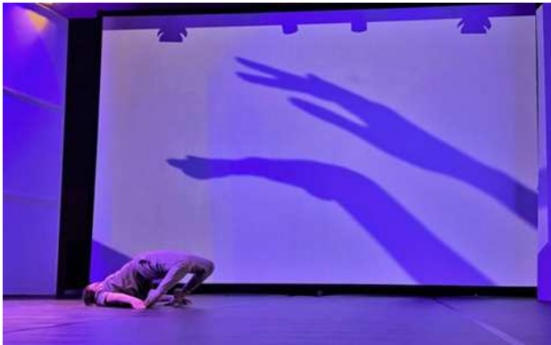
Figure 3. Pictures taken at the rehearsal, video projection.