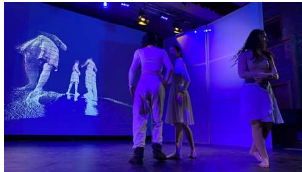
Figura 2. Imagini din timpul repetițiilor, proiecție video bazată pe imagini live, captate cu senzorul Kinect.

organizat după reguli estetice. Mesajul comunicat diferă nu numai în funcție de posibilitățile de expresie ale balerinului, ci și de spațiul în care se exprimă. De aceea o scenografie, în funcție de modul cum este concepută, poate ridica la un nivel superior sau poate ucide o compoziție de balet.