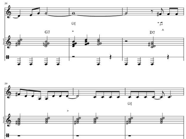
Figura 5. Microanaliză, partea I: interacțiune muzicală 5/6.