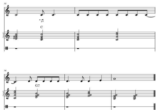
Figura 6. Microanaliză, partea I: interacțiune muzicală 6/6.