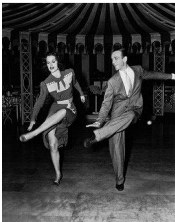
Figura 2. Eleanor Powell și Fred Astaire, dansând în filmul Broadway Melody of 1940

Timpurile postmoderne au susținut simultan cinematografia, arta video și dansul ecranizat, iar fenomenul continuă să evolueze. Spre exemplu, Ansamblul de balet din Moscova și-a dezvoltat propriul proiect digital numit Bolshoi în Cinema; Northern Ballet din Marea Britanie a lansat un program de dans digital, condus de extraordinarul coregraf Kenneth Tindall, iar Scottish Ballet a creat Stagiunea Digitală, punând accentul pe „realitate, identitate și transformare” ( https://www.scottishballet.co.uk/event/digital-season-19 ).