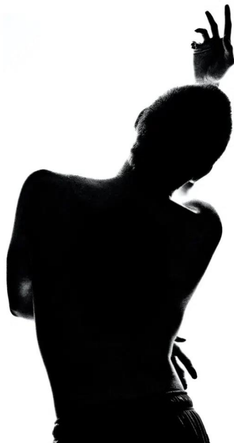
Figura 3. Posterul unui laborator de Screendance din Wicklow (2022)

include o multitudine de subgenuri artistice, printre care se numără următoarele: cinematografia, arta video, artele vizuale și dansul. Sincretismul rezultat stimulează creativitatea și potențialul artiștilor, inspirându-i constant să își depășească zona de confort. Răspândit sub denumirile de dans de film, cine-dans, dans pentru camera de filmat sau video dance, Screendance suscită entuziasm în rândul artiștilor de orice vârstă și, după părerea mea, este imperios necesară integrarea genului în sistemul de educație al tuturor dansatorilor de astăzi.